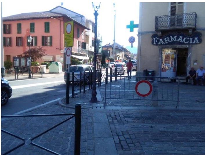
VARCO 1 – Piazza San Lorenzo