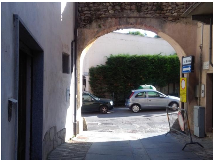
VARCO 3 – Via Sclopis