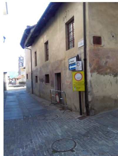
VARCO 2 – Via IV Marzo